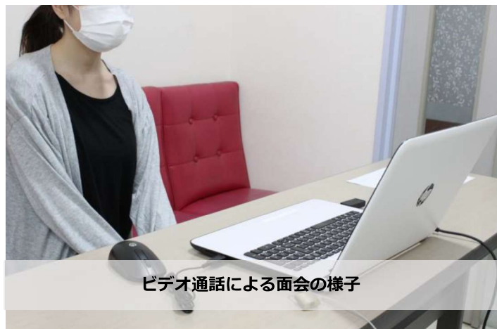
ビデオ通話による面会の様子

新潟市内では令和2年2月29日に1例目の新型コロナウイルス感染症患者が発生しました。そのため、当院では3月から院内感染防止対策委員会を中心に、病院全体で新型コロナウイルス感染症対策に取り組んできました。具体的には、来院者の検温・健康チェック、マスク着用の徹底、手指消毒の徹底、有熱者に対する対応、面会制限、ビデオ通話による面会の導入、外出泊制限、外来待合室での飲食の禁止、フェイスシールドの着用、ポスターでの注意喚起、